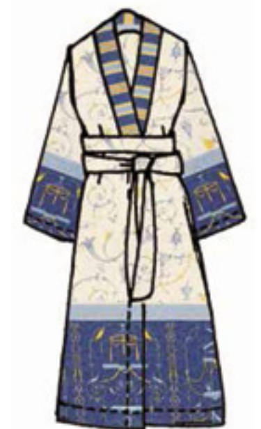
v.9 - v.B3