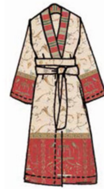
v.8 - v.LC