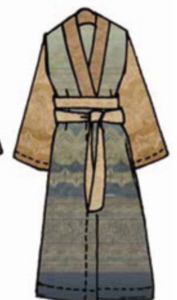
v.7 - v.G6