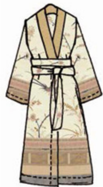
v.8 - v.41