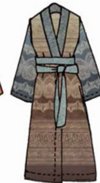
v.6 - v.M1