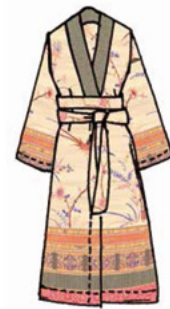
v.2 - v.4M