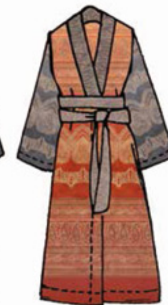
v.9 - v.O1